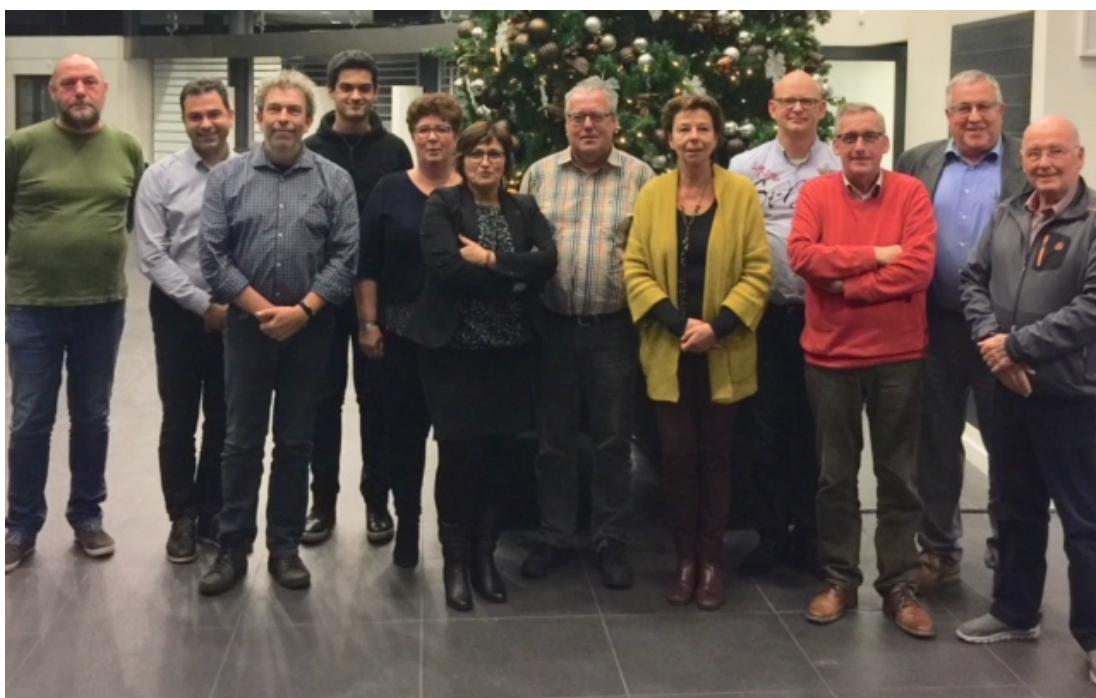
Samenstelling Adviesraad Sociaal Domein Gemeente Steenbergen in december 2017.